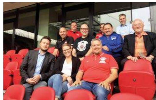
ARBEITSKREIS BFB & DFL

Arminia Bielefeld). Wir gratulieren den Mitgliedern des Arbeitskreises und freuen uns auf eine gute Zusammenarbeit.