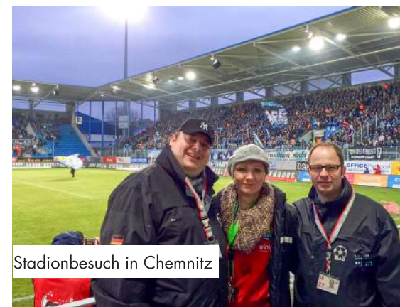
Stadionbesuch in Chemnitz